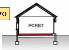
Dallage non isolé sur terre-plein